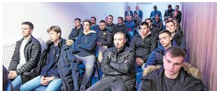
Sj jedne od prezentacija poslodavaca za studente Pomorskog fakulteta